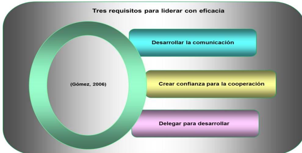
Figura 2: Requisitos para liderar con eficacia

Del mismo modo afirma el autor, el liderazgo es una relación viva y dinámica entre personas, basada principalmente en valores, sentimientos y comunidad de objetivos. Es el arte de relacionarse constructivamente con otras personas y lograr que se movilicen para alcanzar determinados objetivos comunes. Arguye que hay que tener claro que se debe cumplir con tres requisitos para liderar con eficacia: la comunicación, la confianza y la delegación, los cuales se reflejan en la figura 2, y se analizan bajo la fundamentación teórica de Gómez (2006) y a criterio otros autores a continuación: