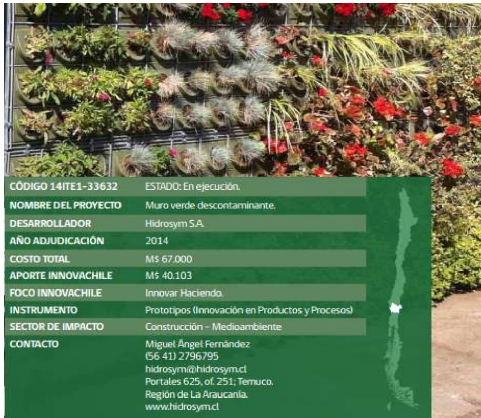
Imagen 1. Especificaciones del proyecto Hydrosym.